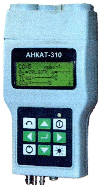
Рисунок 1 - Внешний вид газоанализаторов АНКАТ-310